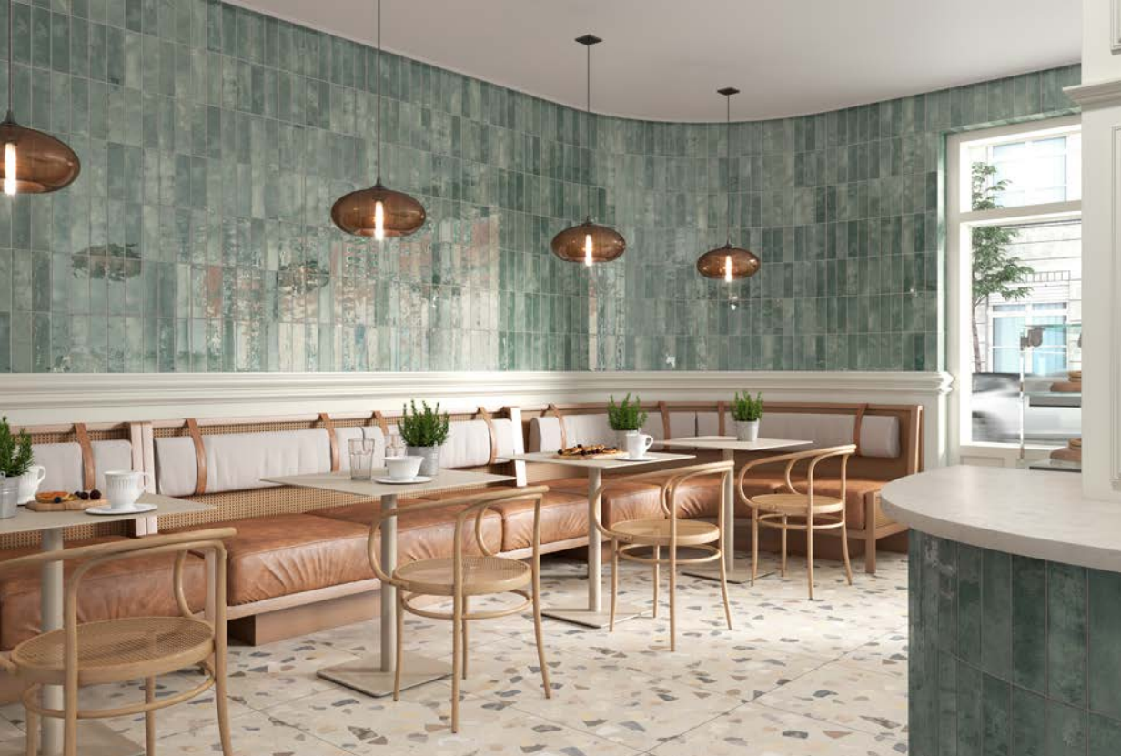
ESPAÇO COMERCIAL COMMERCIAL SETTING