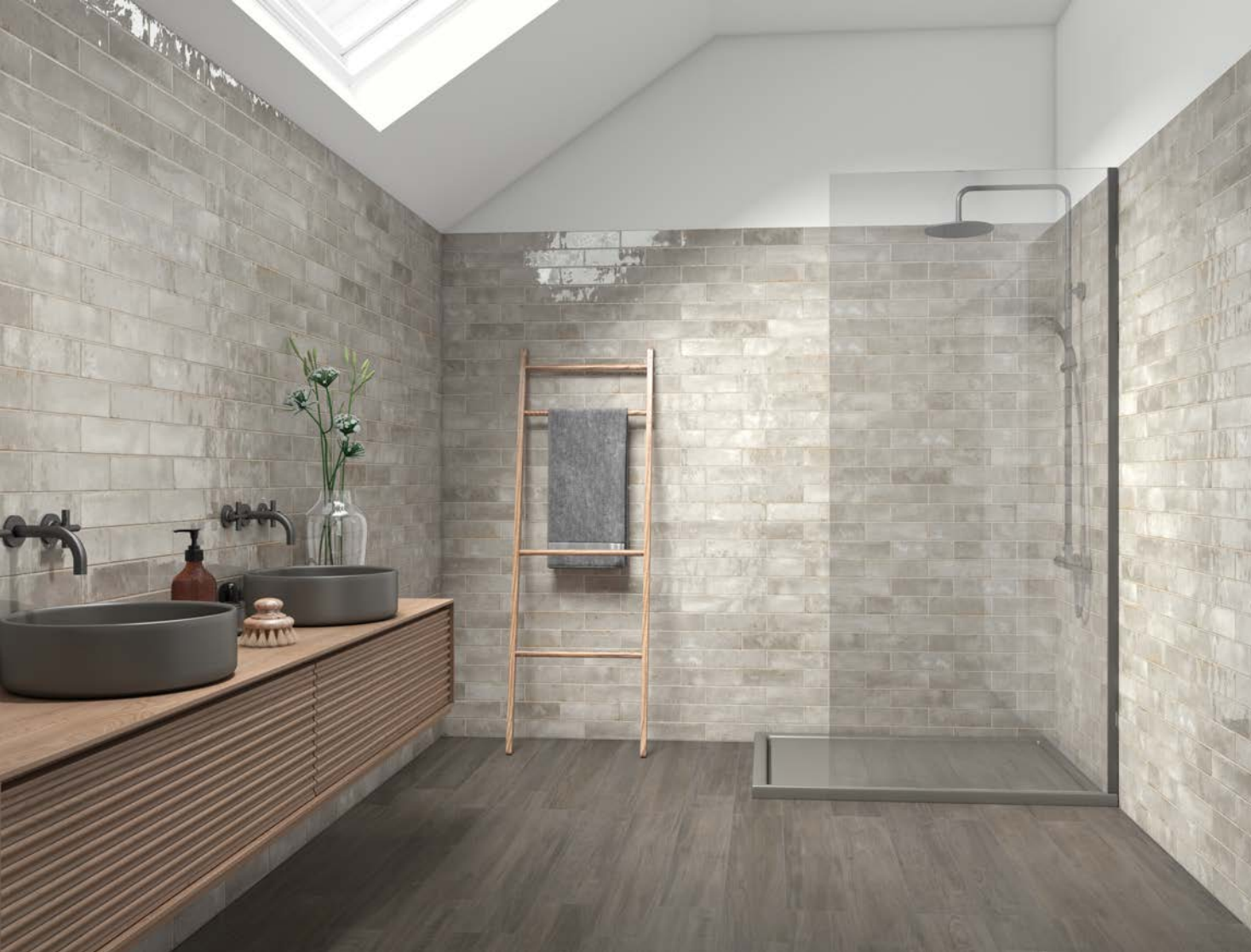
CASA DE BANHO BATHROOM