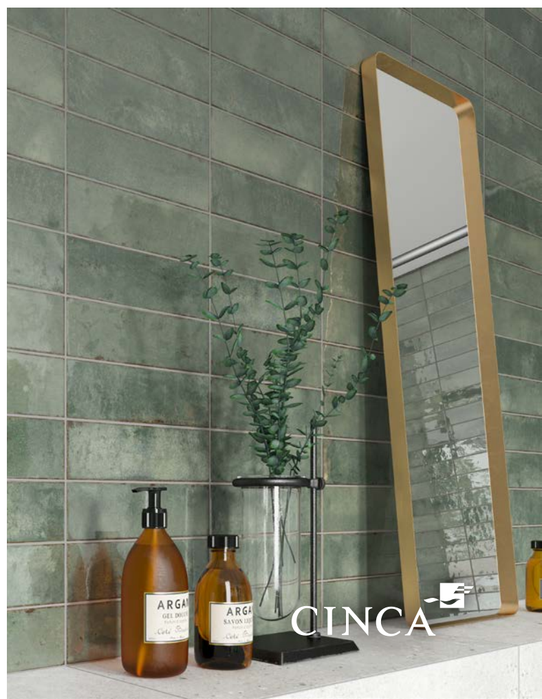
VERDE GREEN 7,5×25 cm 3"×10" | 9185